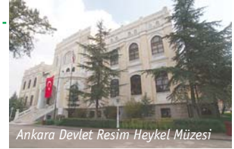
Ankara Devlet Resim Heykel Müzesi

Onur Plaketi'ni, 1981'de yaşayan en yaşlı Türk mimarı olarak Mimarlar Odası Onur Plaketi'ni, yine aynı yıl Atatürk'ün doğumunun yüzüncü yılı dolayısıyla verilen Atatürk Sanat Armağanı'nı aldı. Bundan kısa bir süre sonra, 26 Temmuz 1982'de yaşama veda etti ve İstanbul'da, annesi ile eşi için kendi çizip uygulattığı mezara gömüldü.